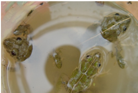
澤蛙類型眾多，這些是體中隔 線明顯的一群~