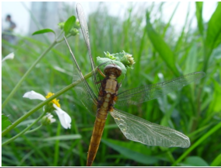
可惜丫羽化失敗的『 擬紅蜻蜓 』媽咪！