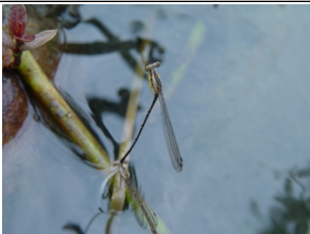
『 脛蹼琵琶 』的水上婚禮！