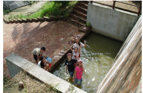
大家一起來看鏡頭，記錄我們一 起尋蛙的辛苦過程！