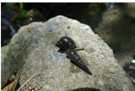
觀察及記錄到『 尖尾螺 及圓田螺』！