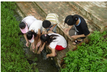
觀察及記錄完後，記得要放回原 棲地喔！