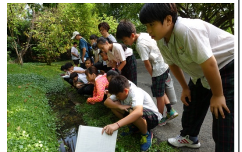
大家聚精會神的尋找台灣米蝦 以及觀察湧泉所形成的泥沼地！