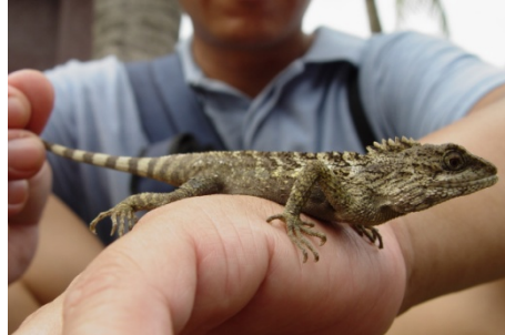
強迫斯文豪氏攀木蜥蜴在我手上拍照！