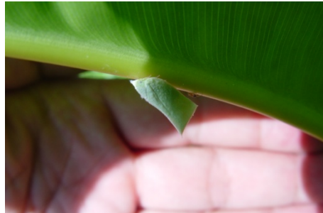
難得一見的青蛾臘蟬，雖然植物 的天敵，但小且綠色挺可愛的……