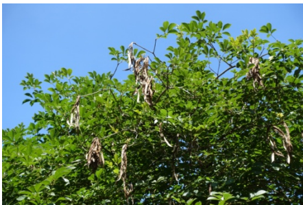
黃花風鈴木的葉型與茄苳葉型相似度極高~~