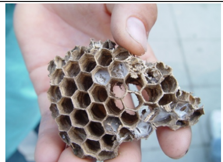
難得一見的蜂巢，看這大小應是『家長腳蜂』的家……