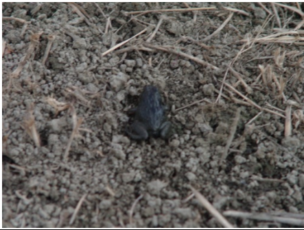
乾涸泥灘地上的虎皮蛙現蹤！