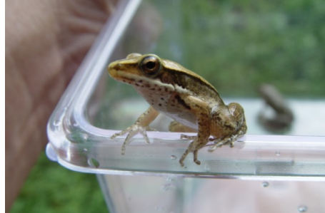
你在看我嗎？我是貢德氏赤蛙小 蛙喔！