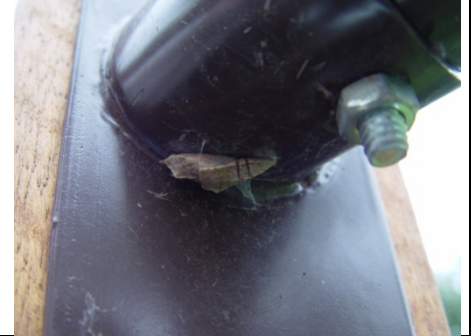
粉難讓人發現的....欄杆下不知名蝴蝶的蝶蛹！