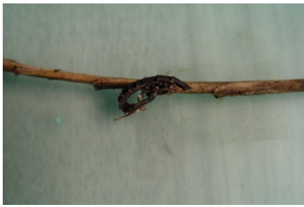
難得一見哦！台灣窗螢幼蟲！