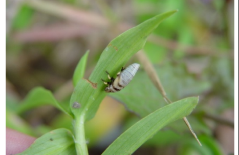
在鴨跖草上...被吹去泡沫保護的沫蟬！