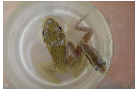
我們辛苦的結果有澤蛙以及貢 德氏赤蛙！