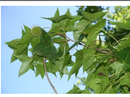
台灣香楓『明顯的互生葉及刺果』 ~