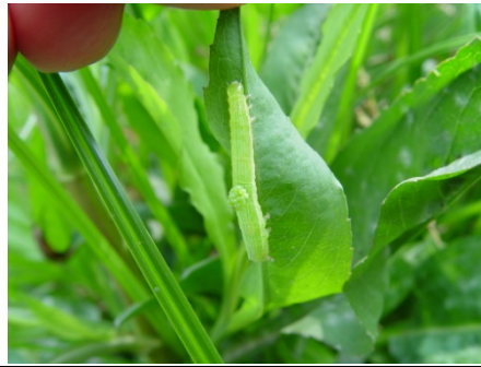
已被寄生蜂下蛋的可憐『 擬尺蠖 蛾』幼蟲！