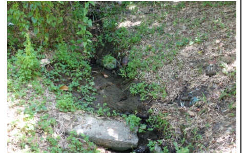
永康公園的命脈，不起眼的角落的湧泉水源地！