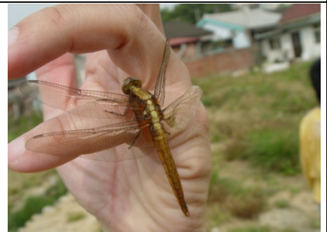
羽化失敗的猩紅蜻蜓的媽咪（母的喔）！