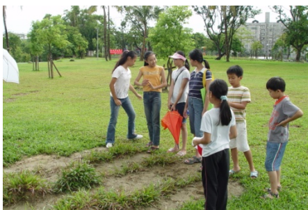
大家一起研究，這一波一波的突起隆坡究竟怎發生的！