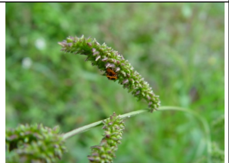
龜紋瓢蟲在增產報國的過程！