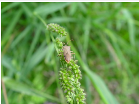
觀察及記錄到『額刺棘緣椿象』！