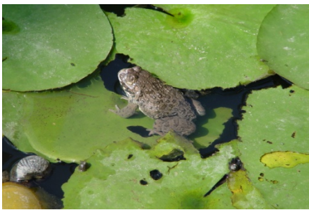
竟然發現有人將養殖的虎皮蛙 放生到蓮花池中！