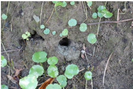
『 南海溪蟹 』的家，門口裝飾著 錢幣草.....