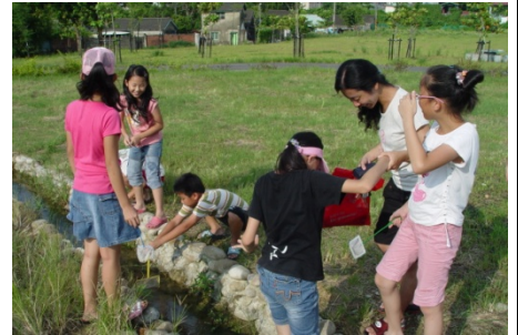
在公園上方實地體驗陷落窪地的感覺！