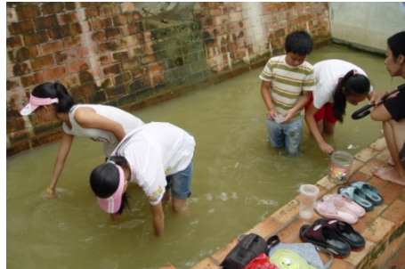
大家一起在跌水步道出口的蓄水 池尋找蛙蹤~