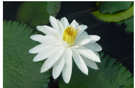
下池塘中盛開得白蓮花！