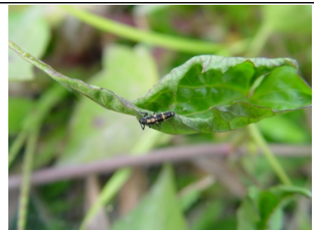
捕獲一龜紋瓢蟲的幼蟲！