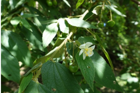
西印度櫻桃開花嚕！