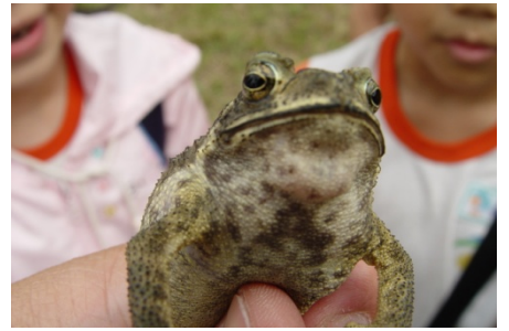
最愛黑色眼影、口紅外加擦黑指 甲油的可愛黑眶蟾蜍！