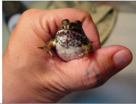
虎皮蛙在我手中只能安份的照相 ~委屈你啦！