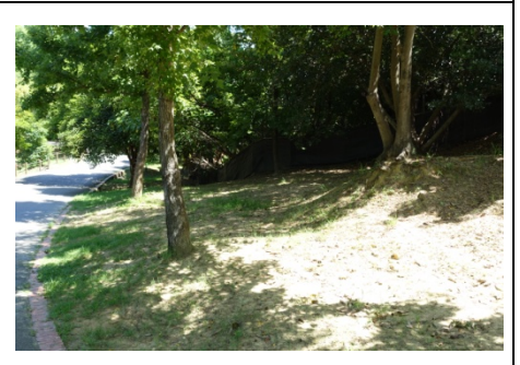
這一片『 台灣窗螢 』的幼兒園... 不知現在.....！